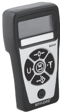
称重显示器键板图